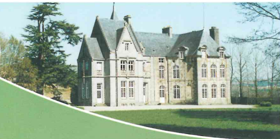
Château de Bois Février