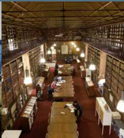
Bibliothèque André Malraux, Rue du 71 e R.I.