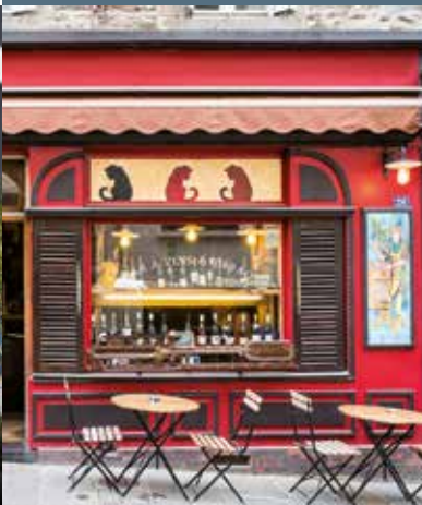
Chez Rollais, Rue du Général Leclerc

Dans son oeuvre, Louis Guilloux (1899-1980) s'inspire avant tout de sa ville natale, Saint-Brieuc, cadre de son enfance et de sa jeunesse, ( La Maison du peuple , Le Sang noir , Le Pain des rêves ) dont il sait évoquer le milieu populaire dont il est issu mais aussi l'ensemble de la société à travers le XX e siècle. L'écrivain excelle à décrire les luttes sociales, les lieux et l'atmosphère de sa ville, sans la nommer, ce qui lui confère une valeur universelle.