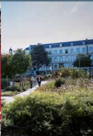
Collège Anatole Le Braz, Rue du 71 e R.I.